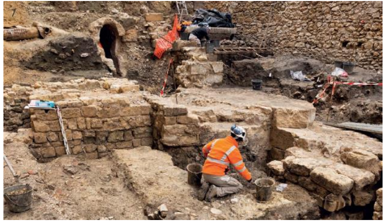
© Denis Gliksman, Inrap - Les experts de l'Archéologie

Images issues des panneaux prêtés par l'INRAP et présentés dans l'exposition